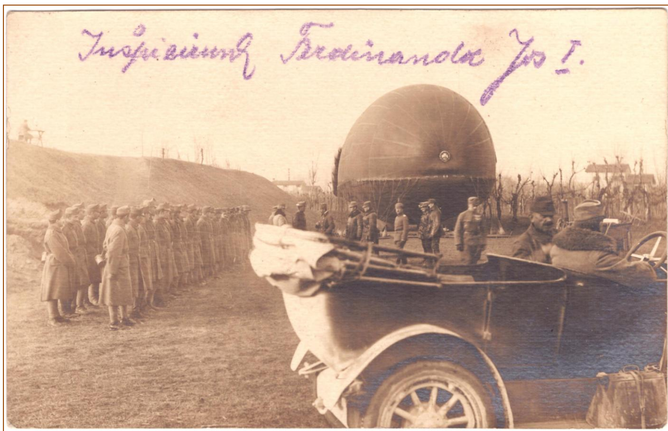
Vzducholodě sloužily především k průzkumu a pozorování.