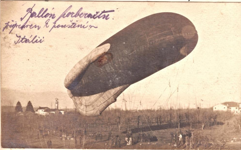
Ballon porobní příprava k pouštění Itálii

porobníci fesh Bolond u Romeri Itálii 1918