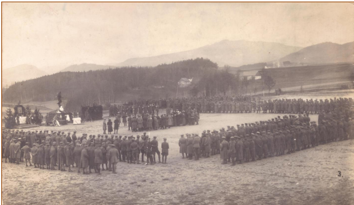
Nástup vojáků – ukrajinská armáda z roku 1920 -21