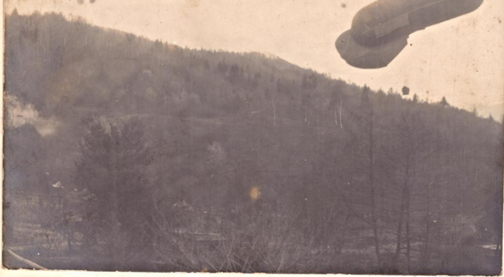
Ballon ve vzduchu nad lesami v okolí v Rumunsku.

v Rumunsku transylvánský otčina 926 m 1917