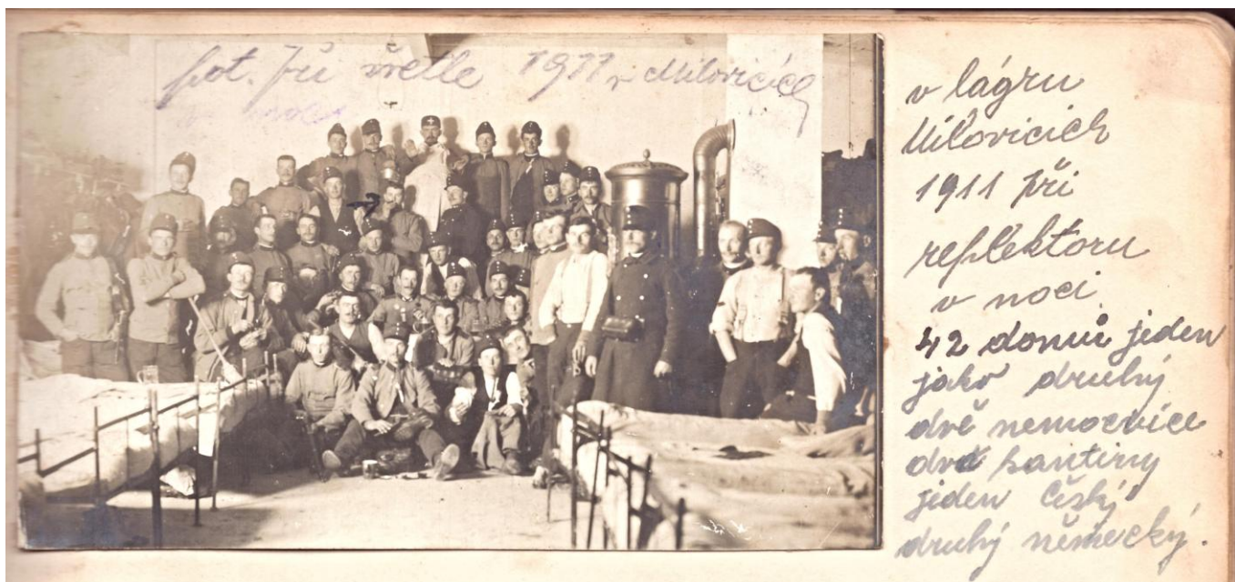
Fotografie vznikla r.1911 při světle reflektoru v zajateckém lágru v Milovicích u Lysé nad Labem. Lágr sloužil pro italské, ruské, srbské a turecké válečné zajatce. Průměrně zde bylo na 30 tisíc zajatců.