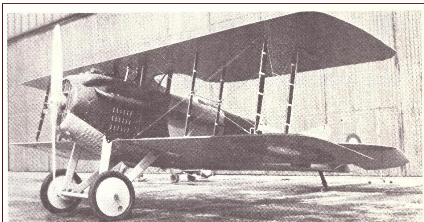
SPAD VII před hangárem leteckého muzea