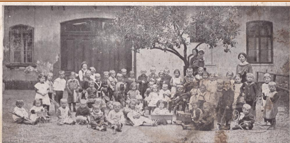
HUSŮV DĚTSKÝ ÚTULEK V HOŘICÍCH.

Zrnka písku tvoří horu, minuty rok, prchavé myšlenky nesmrtelné skutky: groš ke grošiku veliké dílo vykonají.