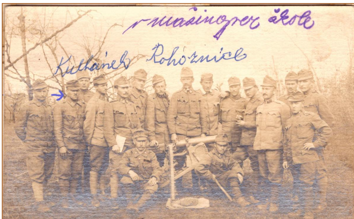
Kulháněk z Rohoznice